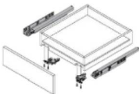
cassetto a 4 lati