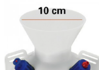
Apertura ad imbuto: caricamento pratico e veloce dei liquidi